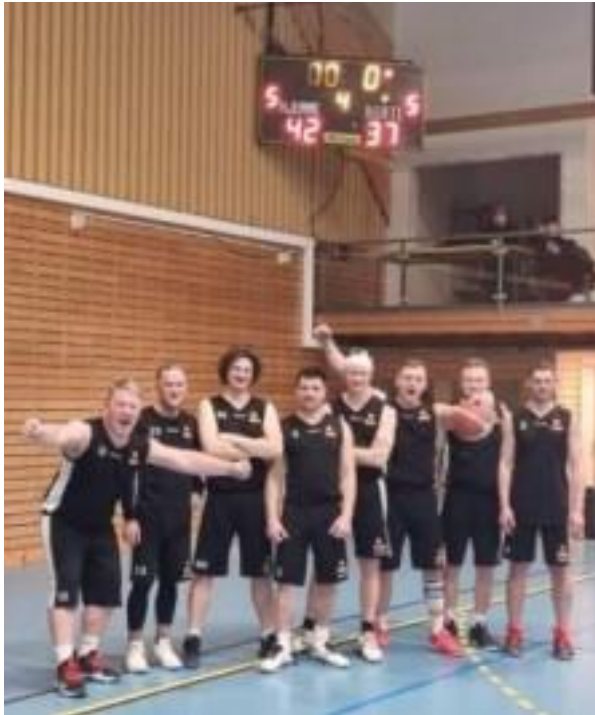
Seniorlag seier mot NTNU.